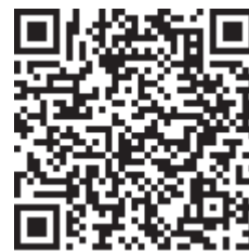
Vidéo 2. Enrichir la situation d'entretien à l'aide d'artefacts

https://mediaserver.univ-nantes.fr/videos/ressource-2-entretiens-enrichis/