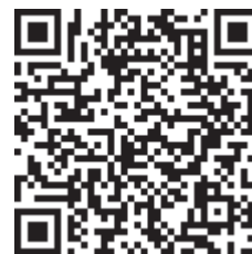
Vidéo 2. Enrichir la situation d'entretien à l'aide d'artefacts

https://mediaserver.univ-nantes.fr/videos/ressource-2-entretiens-enrichis/