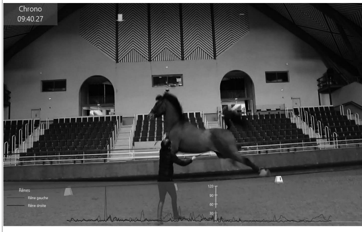
Figure 2. Capture d'écran de la vidéo enrichie d'une représentation graphique des tensions de rênes

« en rythme » ou « en phase avec le cheval » était difficilement perceptible à travers l'analyse comportementale, tant les ajustements sont fins et continus en cours d'action.