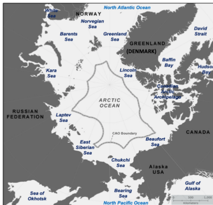
Figure n°1 – La haute mer de l'océan Arctique central et ses mers adjacentes