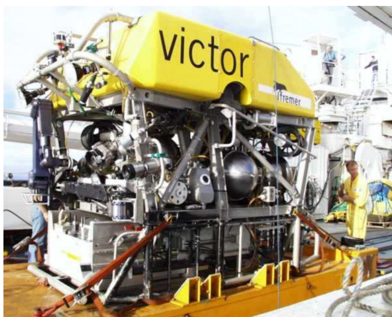
Le robot téléopéré le « Victor 6.000 » de l'IFREMER

Effectue régulièrement des missions d'explorations scientifiques à bord du brise-glace allemand Polarstern depuis 1999.