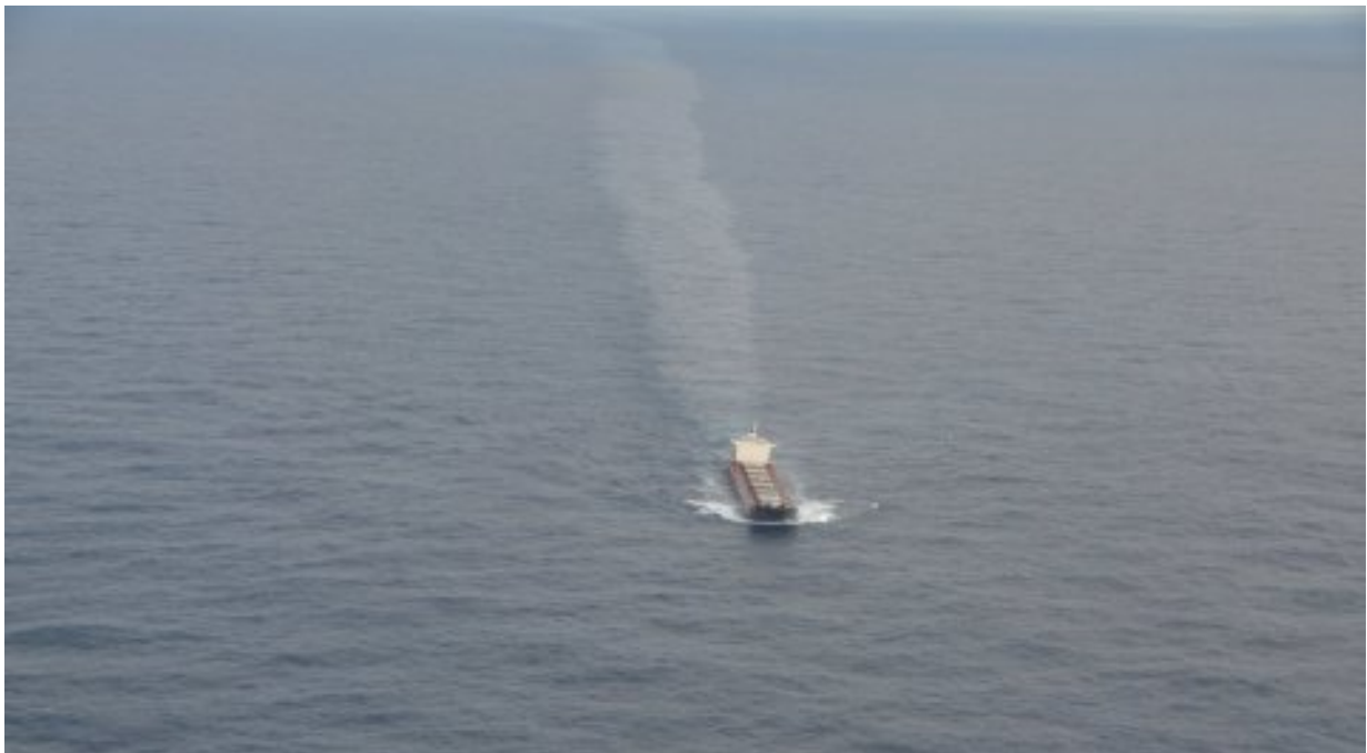
Pollution navire Thisseas

Le 24 février 2016, a été constatée en zone économique exclusive française, dans le sillage du navire Thisseas battant pavillon du Libéria, la présence d'une nappe d'hydrocarbures. Le 6 avril 2016, le Libéria a informé les autorités françaises que, sur action du ministère de la justice libérien, un tribunal avait débuté une enquête et une procédure judiciaire contre les armateurs et opérateurs du navire ; le Libéria a sollicité à plusieurs reprises la suspension des poursuites engagées en France sur la base de l'article 228 de la Convention des Nations unies sur le droit de la mer ; le 2 novembre 2016, le Premier ministre français a décidé de ne pas donner de suite favorable à cette demande, faute de disposer d'élément précis permettant d'envisager des poursuites effectives, tant en procédure que sur le fond du droit, de telle sorte qu'il maintenait la compétence de la juridiction française, ce dont le Libéria a été officiellement informé le 26 novembre 2016.