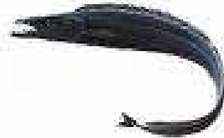
Le sabre noir 8

Peut mesurer jusqu'à 110 cm. Son espérance de vie atteint les 32 ans et sa maturité est fixée à l'âge de 7 ans. Son milieu de vie naturel se situe entre 200 et 1 700 m de profondeur.