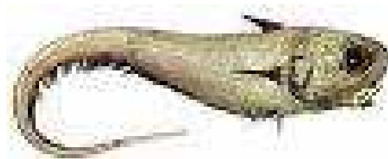
Le grenadier de roche 9

Peut mesurer jusqu'à 110 cm. Son espérance de vie atteint les 32 ans et sa maturité est fixée à l'âge de 7 ans. Son milieu de vie naturel se situe entre 200 et 1 700 m de profondeur.