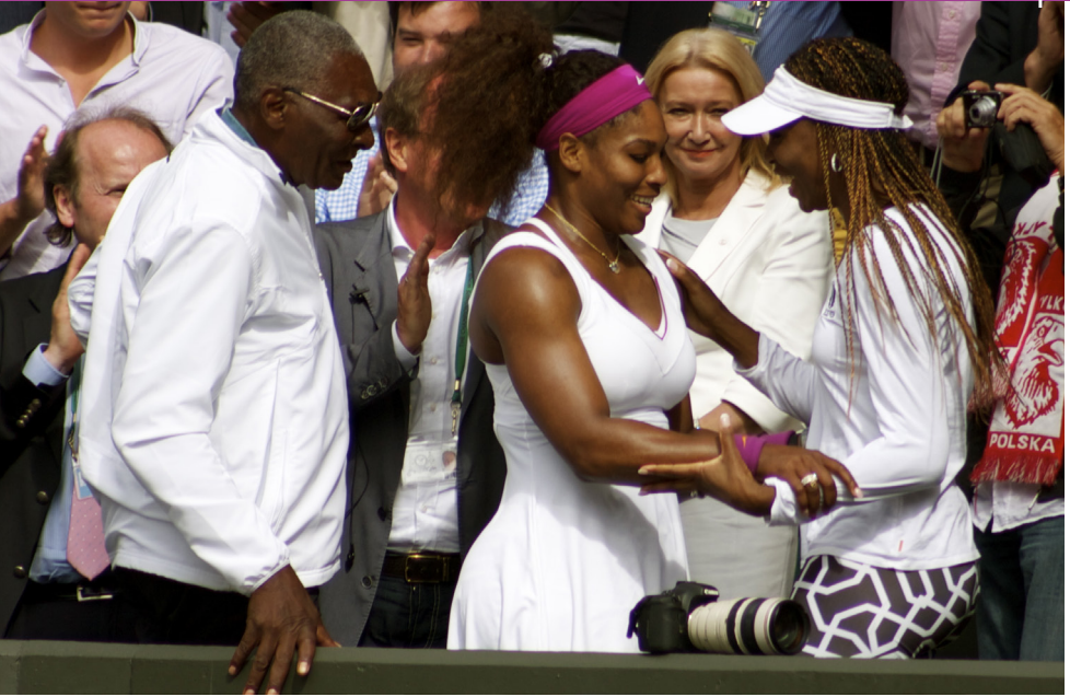
© Paulobrad (Wikimedia Commons) - Richard Williams avec ses filles peu après la victoire de Serena, en 2012, à Wimbledon.

reconnu coupable de 27 tentatives d'empoisonnement à l'encontre des adversaires de son fils et de sa fille entre 2000 et 2003, histoire portée à l'écran sous le titre Terre battue en 2014. Au-delà de cet exemple extrême, selon des entraîneurs de tennis américains, 58,9 % des parents auraient une influence positive sur le développement de leur enfant, tandis que 35,9 % d'entre eux auraient une influence négative (Gould, Lauer, Rolo, Jannes et Pennisi, 2006). Les premières recherches, réalisées il y a quarante ans, se sont focalisées sur la quantité d'investissement des parents. Ces dix dernières années, l'accent a été porté sur la qualité de cet investissement parental, jugée plus importante. Ainsi, plusieurs études ont mesuré l'impact des