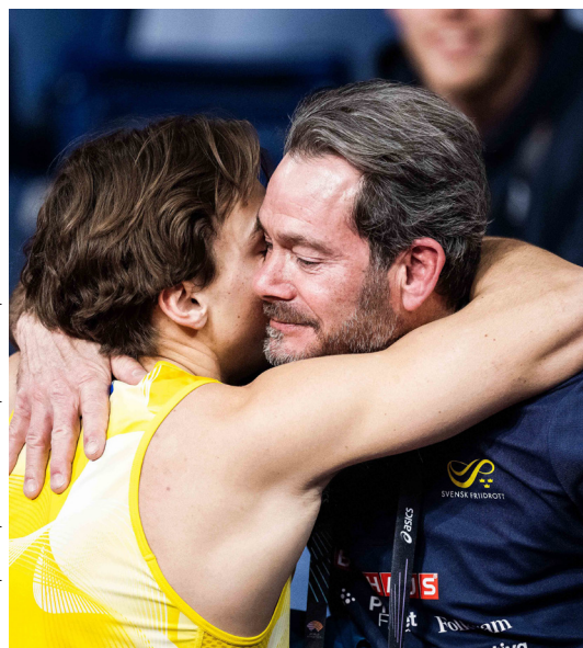
Le perchiste Armand Duplantis avec son père.

Les parents impactent les expériences de leur enfant tout au long de leur carrière sportive. Globalement, ils sont tous bien intentionnés. Toutefois, ils ne sont pas experts. Ils ont besoin d'informations et de formations pour appréhender un monde qu'ils découvrent bien souvent en même temps que leur enfant. Ainsi, il paraît indispensable que les structures sportives travaillent de façon proactive avec les parents au lieu de les tenir à l'écart (Harwood, Knight, Thrower et Berrow, 2019). Ce travail devrait être réalisé dès le début de l'investissement de l'enfant, mais également tout au long de sa carrière ►