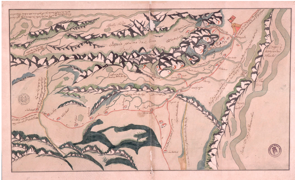
Figura 3 Mapa do território da capitania da Bahia, compreendido entre o rio São Francisco, o rio Grande e o riacho chamado Gavião, que divide o termo da vila do Fanado da vila do Rio das Contas, 1758. AHU-CARTm-005, D. 980.

Cuiabá, realizado na ocasião da viagem do governador Luís de Albuquerque de Melo Pereira e Cáceres em 1772 (Araujo, 2015).