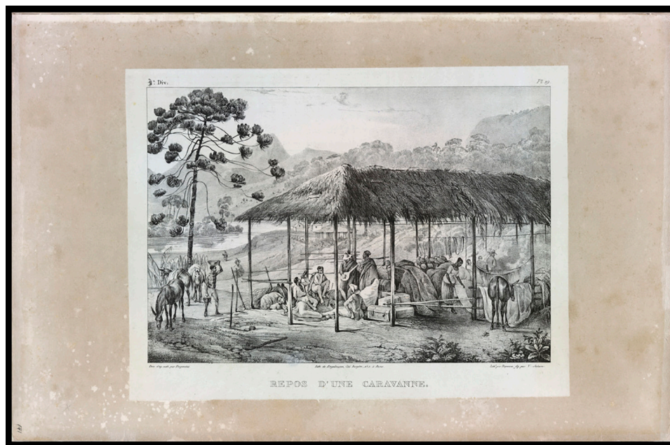
Figura 1 Johann Moritz Rugendas. Repos d'une caravane .

O estudo histórico dos pousos no Brasil se depara com dois empecilhos: de um lado, uma memória coletiva que valoriza o pouso de tropeiros, tanto que a figura do tropeiro foi associada ao símbolo do “homem livre na ordem escravocrata” (Franco, 1976 [1969]). Uma valorização que se beneficiou da difusão da iconografia oitocentista (geralmente oriunda dos relatos de viajantes europeus), que associou a imagem do pouso a um rancho aberto e coberto de sapé, no qual os tropeiros descansavam ao som de uma viola, como o representou Johann Moritz Rugendas na prancha Repos d'une caravane (1835).