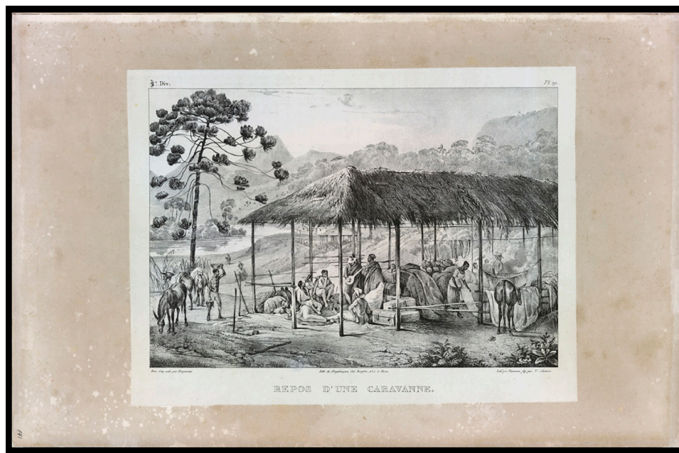
Figura 1 Johann Moritz Rugendas. Repos d'une caravane .

O estudo histórico dos pousos no Brasil se depara com dois empecilhos: de um lado, uma memória coletiva que valoriza o pouso de tropeiros, tanto que a figura do tropeiro foi associada ao símbolo do “homem livre na ordem escravocrata” (Franco, 1976 [1969]). Uma valorização que se beneficiou da difusão da iconografia oitocentista (geralmente oriunda dos relatos de viajantes europeus), que associou a imagem do pouso a um rancho aberto e coberto de sapé, no qual os tropeiros descansavam ao som de uma viola, como o representou Johann Moritz Rugendas na prancha Repos d'une caravane (1835).