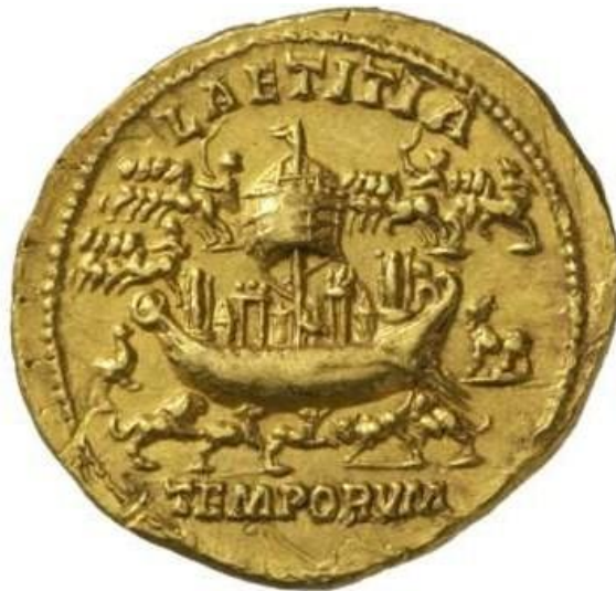
Aureus de Septime Sévère pour ses Décennales (202 n.e.)