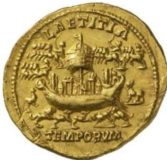
Aureus de Septime Sévère pour ses Décennales (202 n.e.)